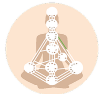
Gegenüberliegendes Tor im Kanal definiert