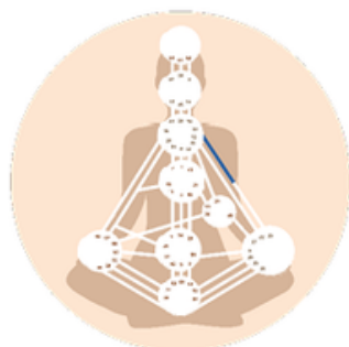
Definiertes Tor im Kanal