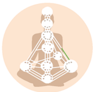
Definiertes Tor im Kanal